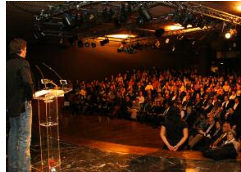
Estreno en Casa de América de Madrid el 12 de enero, aniversario del terremoto

En 2010 se han realizado estrenos en Valencia y Murcia, y el 12 de enero arrancó en Madrid la gira solidaria de Sueños de Haití 2011, que nos llevará a Pamplona el 10 de marzo, a Paterna (Valencia) el 12 de marzo, el 17 de marzo a Toledo, el 9 de abril a Bilbao, y otras muchas pendientes de confirmación, ya que la gira continuará a lo largo de todo el año siempre con la misma finalidad: que continúe el envío de ayuda a Haití.