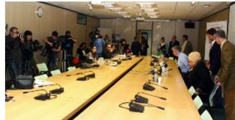
Rueda de prensa en el SEGIB el 12 de enero