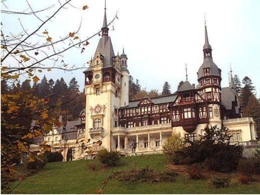
El Castillo Peles en Sinaia, fundado por el primer Rey de Rumania, Carlos I