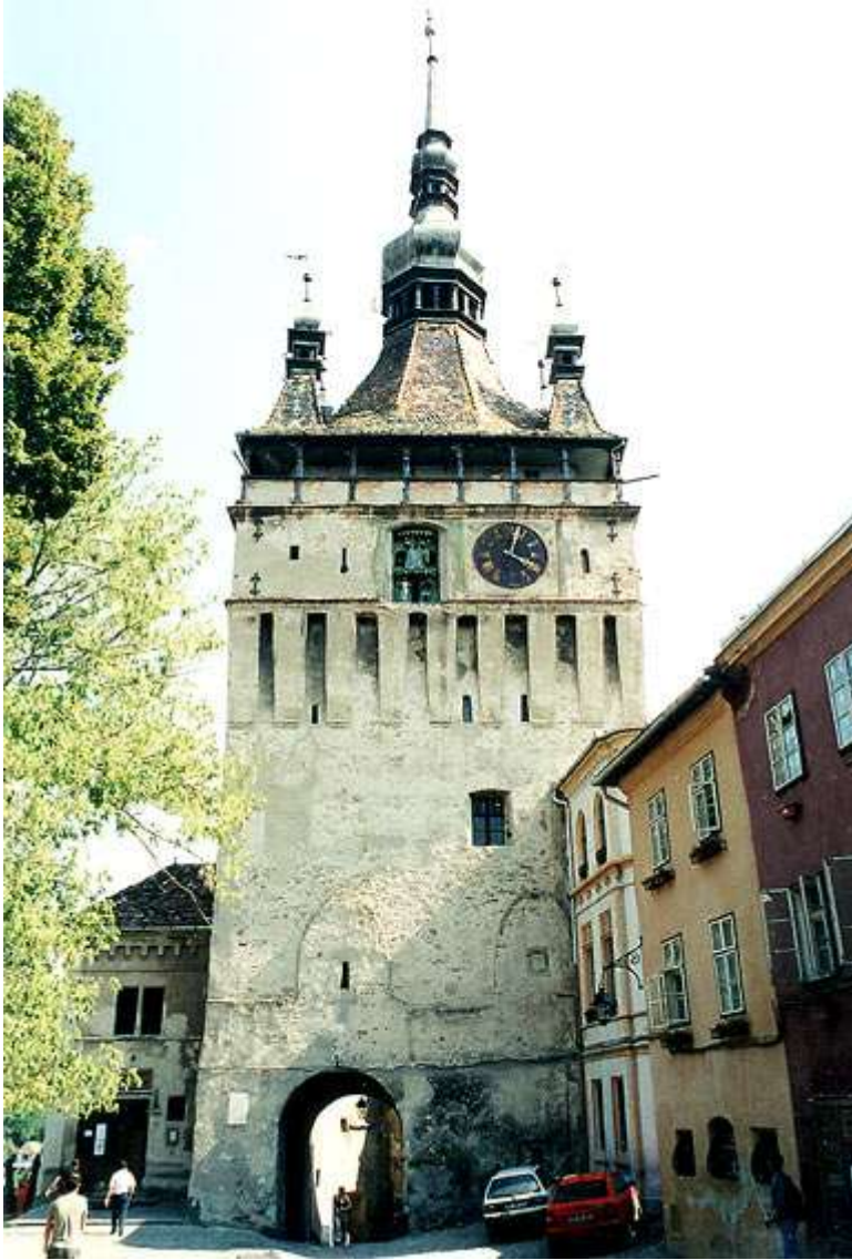
La Torre del Reloj de Sighisoara

La ciudad medieval de Sighisoara, una de las más importantes ciudades medievales del mundo. En los catálogos de UNESCO, Sighisoara aparece como la ciudad donde nació el famoso príncipe de Valaquia, Vlad el Empalador, mejor conocido como “Drácula”. Visita del Museo de Historia situado en la Torre del Reloj, el Museo de las Armas y la Cámara de Tortura.