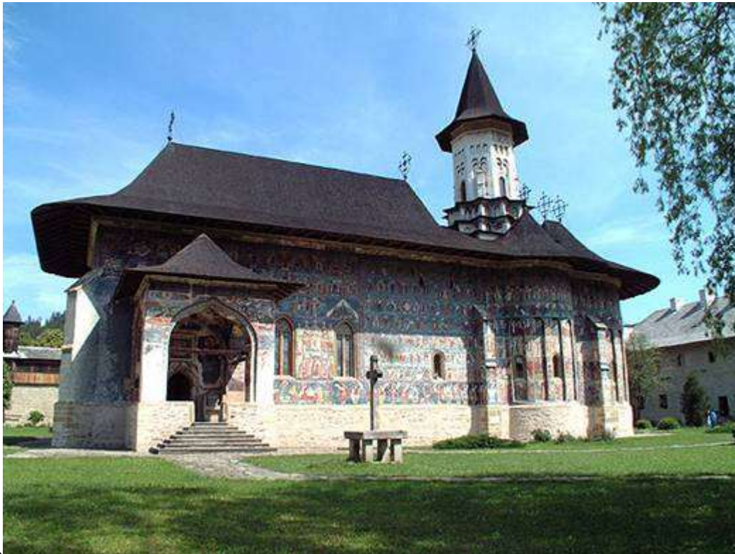
Monasterio de Sucevita