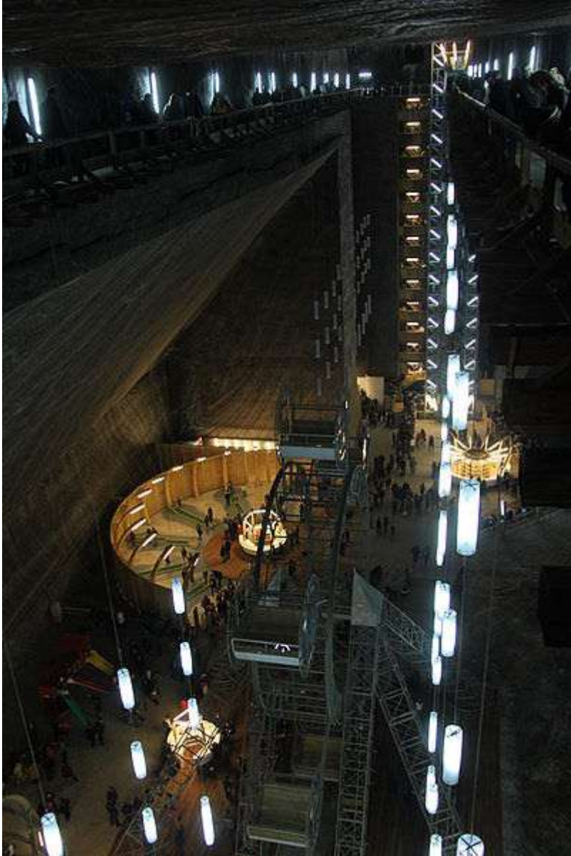
Salina de Turda