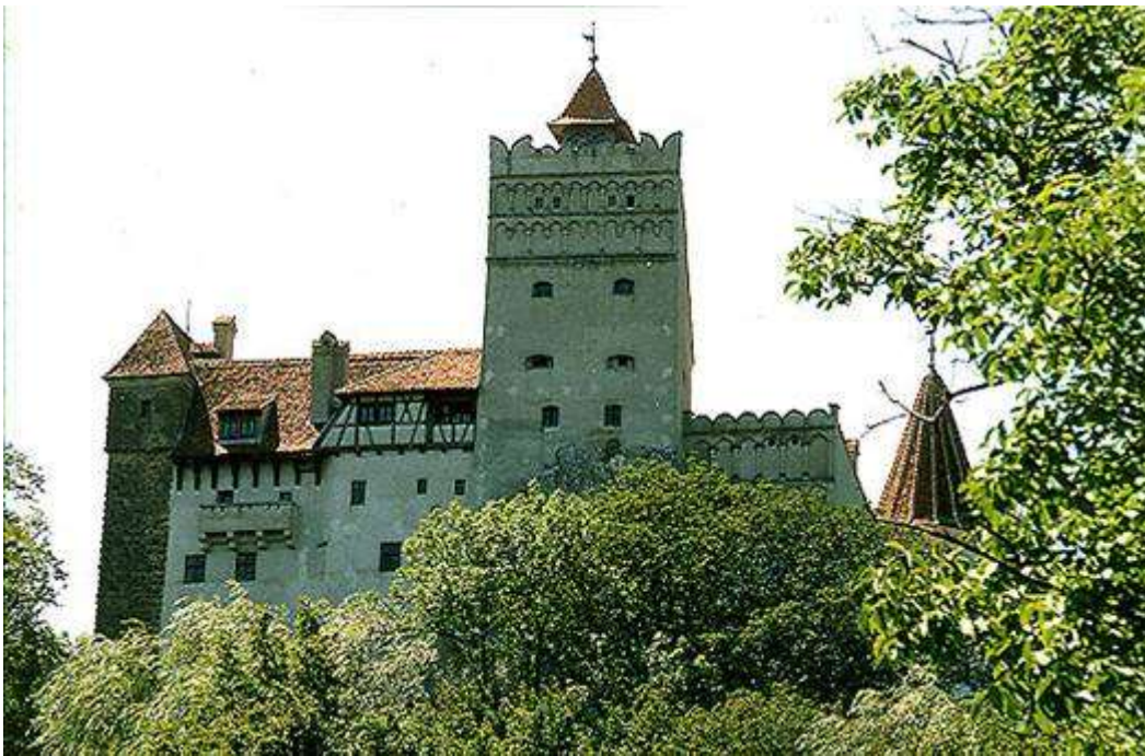
El Castillo de Bran