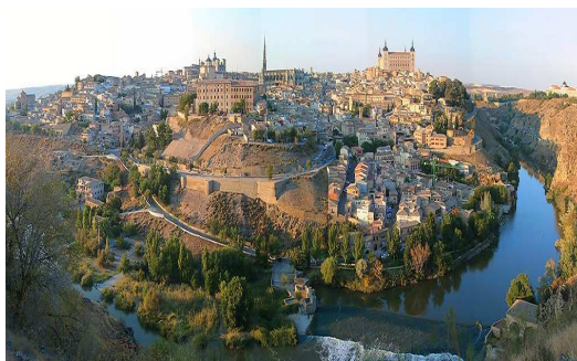
Vista de Toledo

Allí oraremos con todos los que buscan a Dios.