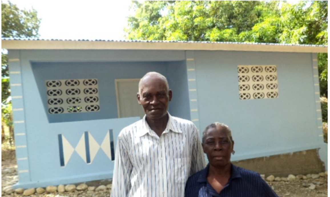
Ejemplo de casa construida