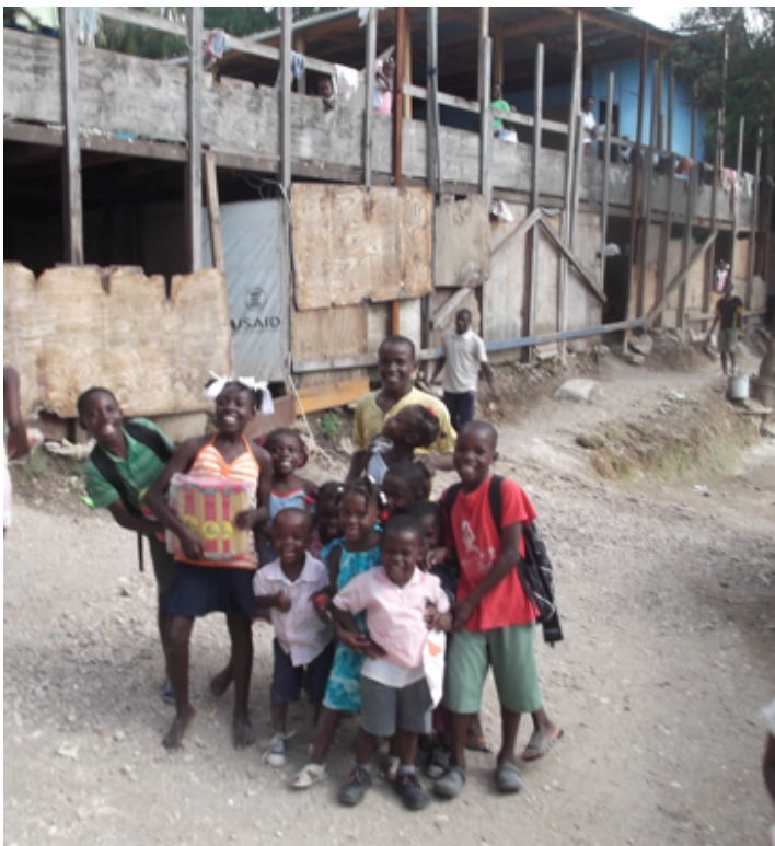
Estado de la vivienda 2013

Objetivo específico: Proporcionar una vivienda digna y segura a los 65 niños huérfanos que viven en el orfanato.