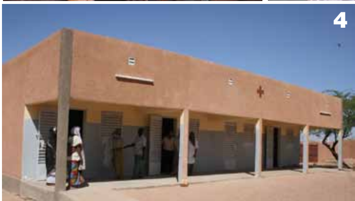
Fotos 1 y 2: INTERNADO DE TCHIROZÉRINE Fotos 3, 4 y 5: CENTRO DE SALUD DE TCHIROZÉRINE